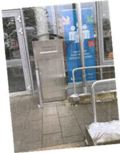
Rückgabebox in Waldram