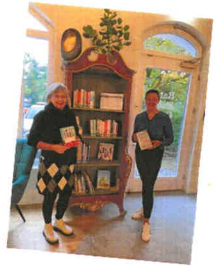
Bücherschrank im Rathauscafé