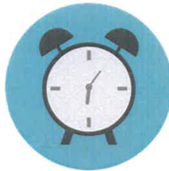
Mittwoch längere Öffnungszeiten